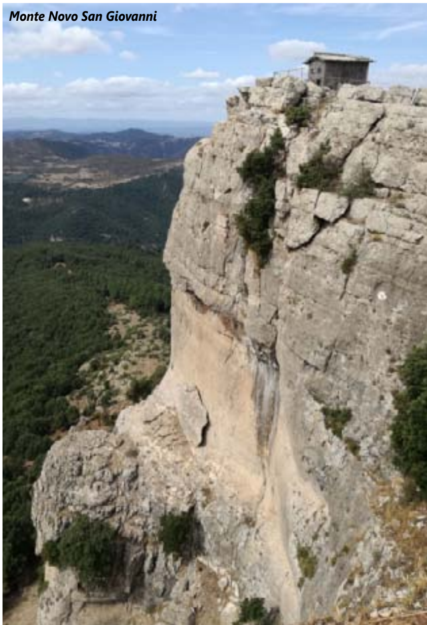
Monte Novo San Giovanni

La cima si allunga suggestiva verso il mare, luogo ideale di sosta. Scendendo proseguiamo per altro luogo panoramico con una costruzione a torretta, il custode ci saluta volentieri, siamo una gradita compagnia della stagione ormai solitaria. La nostra uscita non poteva finire che al mare, quella distesa azzurra ci ha chiamato tutto il giorno; allora ripartiti, raggiungiamo Cala Liberotta, con una bella pineta e arenile a sassolini delimitato da roccette. Finita la stagione dei grandi esodi, poche persone, quiete, acque limpide e calde, gioia di stare assieme.