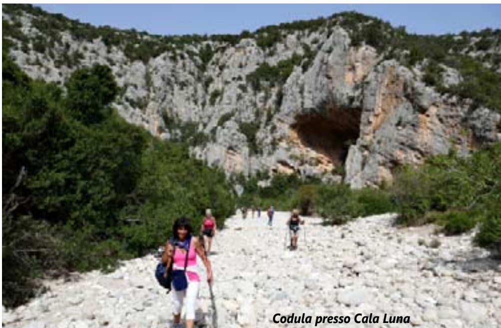
Codula presso Cala Luna

giorni insieme, delle bellezze, delle emozioni diverse, prima che ognuno si allontani dall'esperienza comune, prima che si torni al nostro orizzonte umbro.